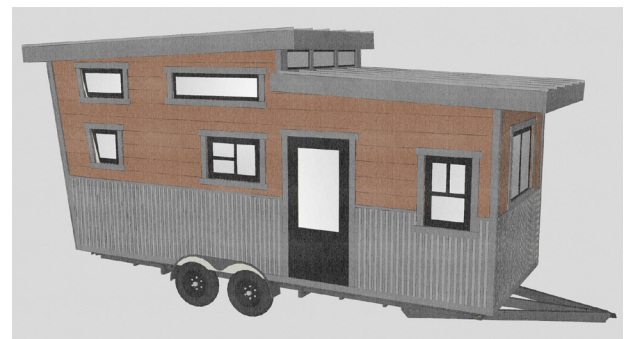
CLAM's new ADU for Third Street - a "tiny home" with huge style.

When a community land trust acquires a home, it has the option to either rent or sell the house while continuing to own the ground. When a family buys a CLT home, they purchase only the house and enter into a long-term agreement – usually a 99-year ground lease – with the CLT to lease the land. By taking the cost of the land out of the real estate transaction, CLTs greatly decrease the cost of homeownership, which is often otherwise prohibitive for lower-income people seeking to buy a home.