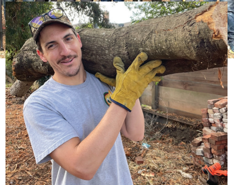
Miembros de "The Torch" y Pacific Slope Tree Company trabajando arduamente para renovar 60 Third Street.