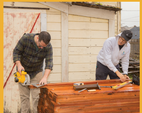
March 2024 Volunteer Workday

Thank you to our volunteers! ¡Gracias a nuestros voluntarios!