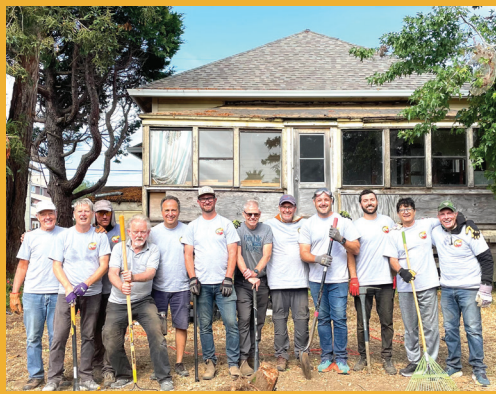
The Torch Volunteer Group